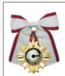
2013日本東京 世界創新天才發明展 金牌獎及特別天才獎 2013 World Genius Convention Genius Gold Medal & Special Genius Award in Tokyo, Japan