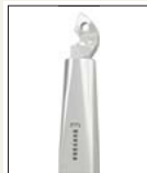
國家發明獎 法人組銀牌獎 Invention Award of Taiwan