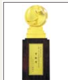
國家發明創作貢獻獎 Invention and Creation Awards of Taiwan- Contribution Award