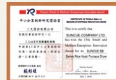
中小企業創新研究獎 Innovation Research Award