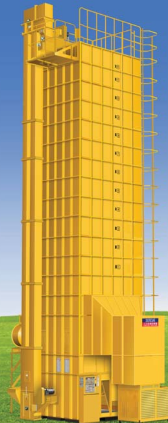
Husk type PHS-320B Cascarilla de arroz PHS-320B